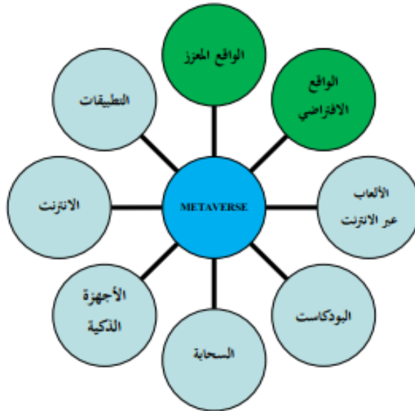
الشكل رقم 3: التقنيات التي يشملها الميتافيرس

المصدر: الميتافيرس وتحدي الحرية والحقيق قراءة تحليلية في نموذج الحرب الروسية الأوكرانية، المجلد 4، العدد 1، ص 29.