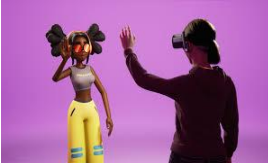
الشكل رقم 2: تجسيد شخصية في عالم الميتافيرس avatar